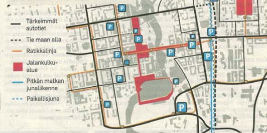
Teksti: Sari Sainio, Grafiikka: Teemu Hotti/Aamulehti

Työryhmän näkemys on, että ydinkeskusta kuuluu jalankulkijoille. Parkkipaikat Hämeenkadun alla ja reunoilla tekevät keskustasta helposti saavutettavan. Joukkoliikenneasemat keskitetään rautatielaseman paikalle tehtävään matkakeskukseen. Kaupungin sisäinen liikenne hotuu ratikoilla sekä busseilla. Niiden verkko on nykyistä tiheämpi.